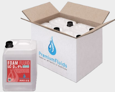
Cartons 6x2,5L – 4x5L