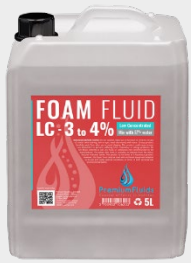
Bidons 2,5L – 5L – 10L – 20L 200L -1000L